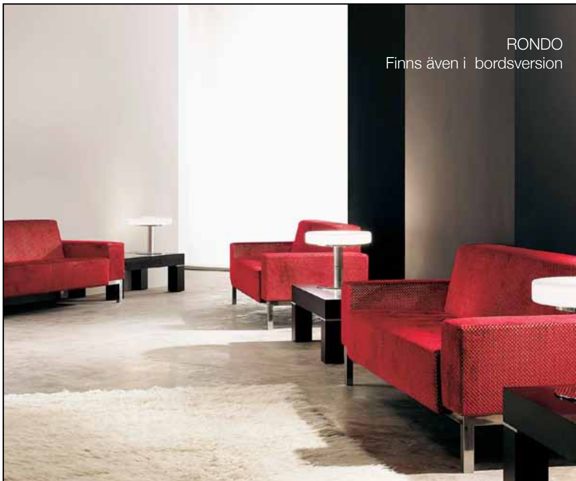
RONDO Finns även i bordsversion